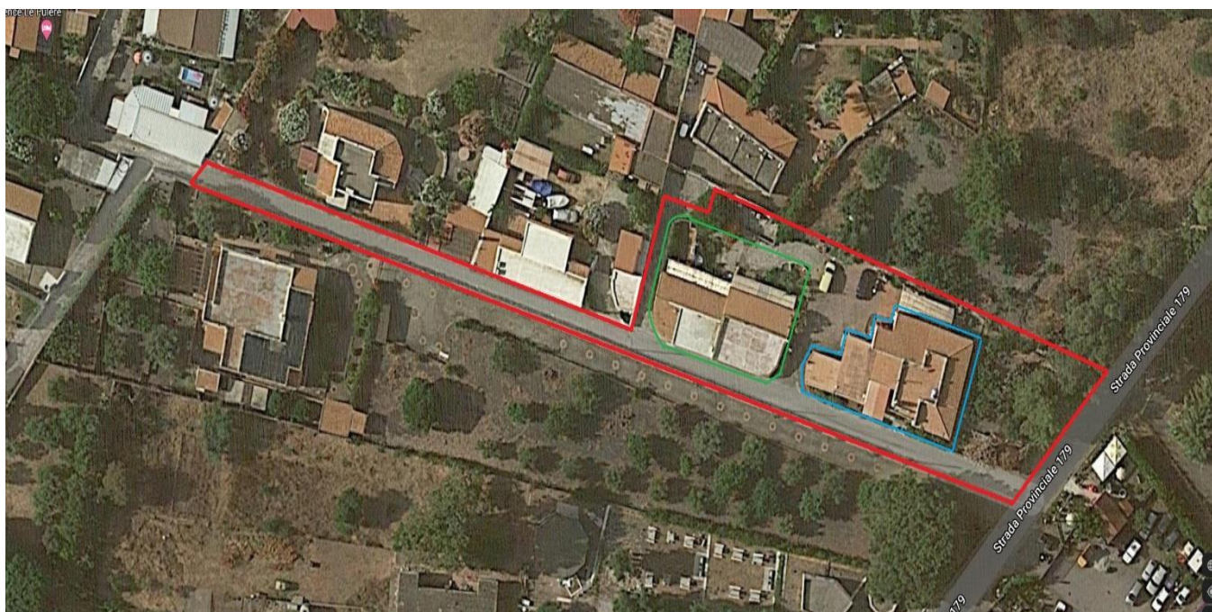
Immagine 1 - Ortofoto tratta da Google con indicazione di massima dei beni in esame Contorno rosso Fg.4 Part.74, Contorno verde Part.702 e Contorno blu Part.326.

Le finiture interne sono di mediocre livello, comprende cucina abitabile, w.c, camera da letto , il tutto evidenziato nella sottostante planimetria catastale e documentazione fotografica .