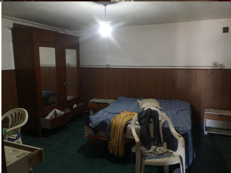
Visione interna Lotto 2