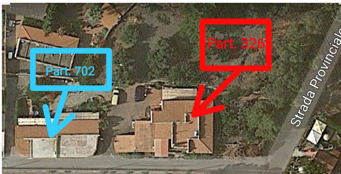
Immagine 1 - Ortofoto tratta da Google con indicazione di massima dei beni in esame

G.E: DOTT. GIUSEPPE LO PRESTI CTU: DOTT. ING. NUNZIATINA TORRE