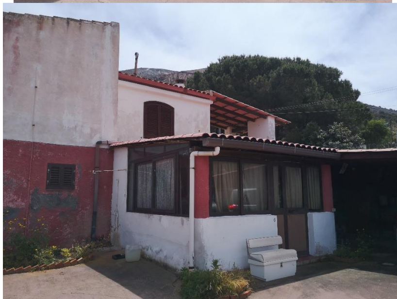
Visione esterna Lotto 2