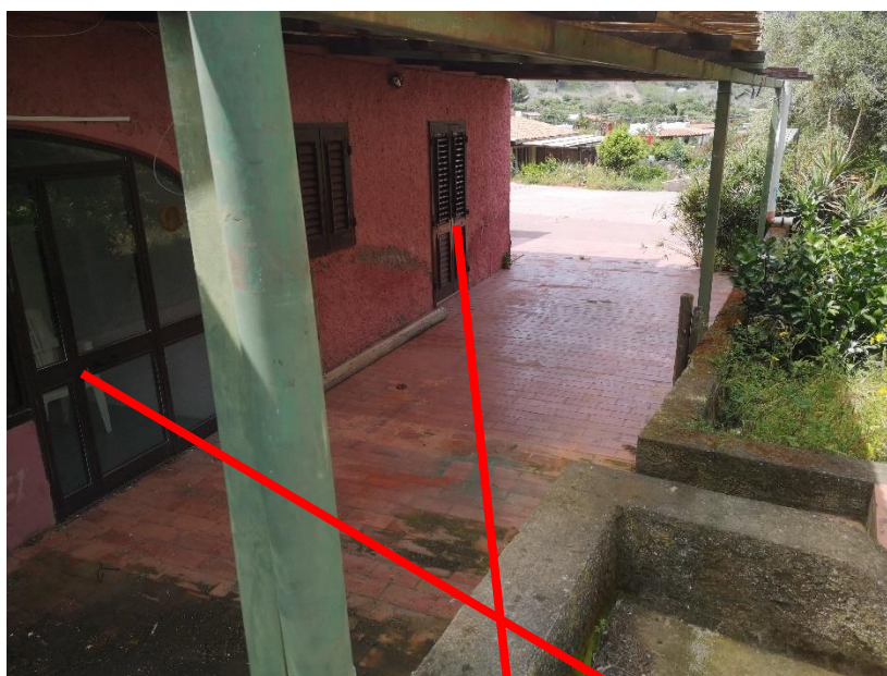
Veranda Comune Lotto 3 e Lotto 4