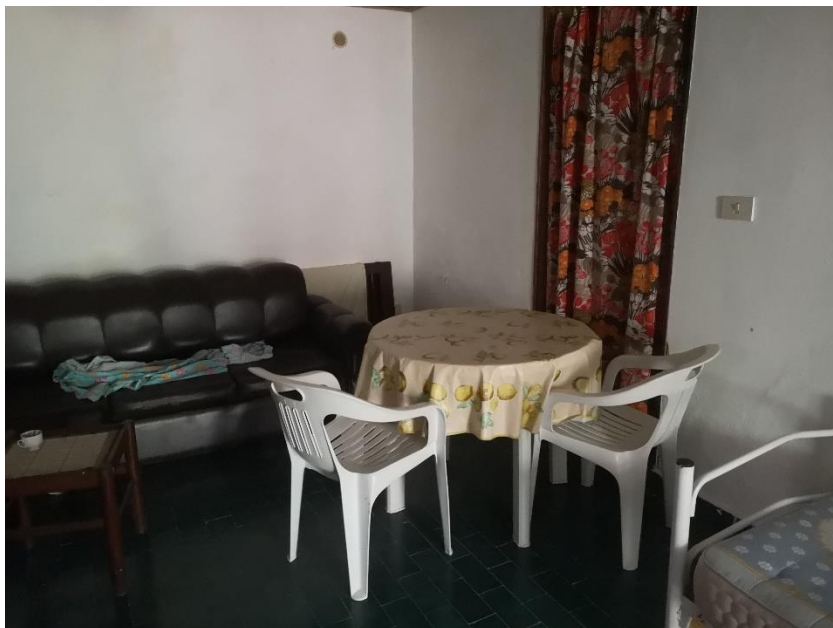
Visione interna Lotto 4