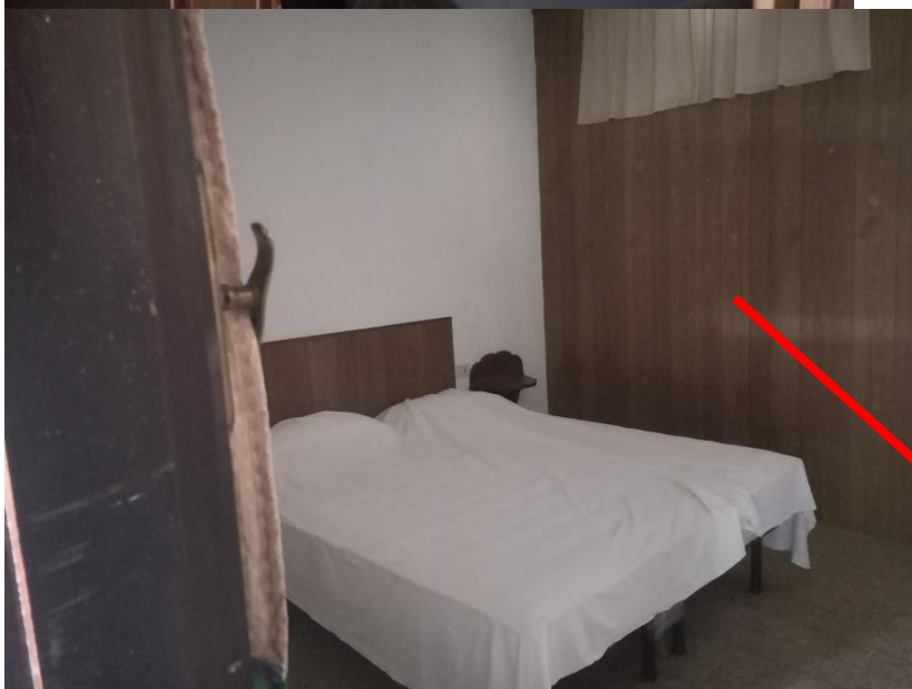
stanza ricavata con assi di perlinato