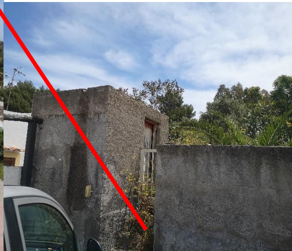
Ingresso laterale sul Sub.5 (B.N.C.)