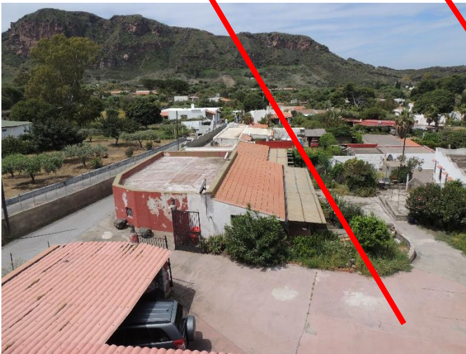
Ingresso Principale sul Fg.4 Part. 74