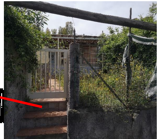
Ingresso laterale sul lotto 6