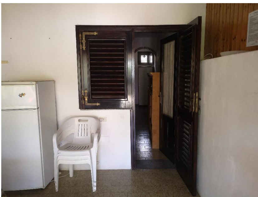
Visione Interna Lotto 9